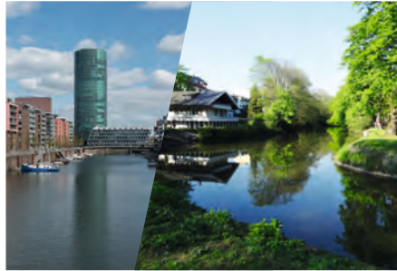
Feiern Sie mit uns die Sommerkirche zwischen Main und Nidda.